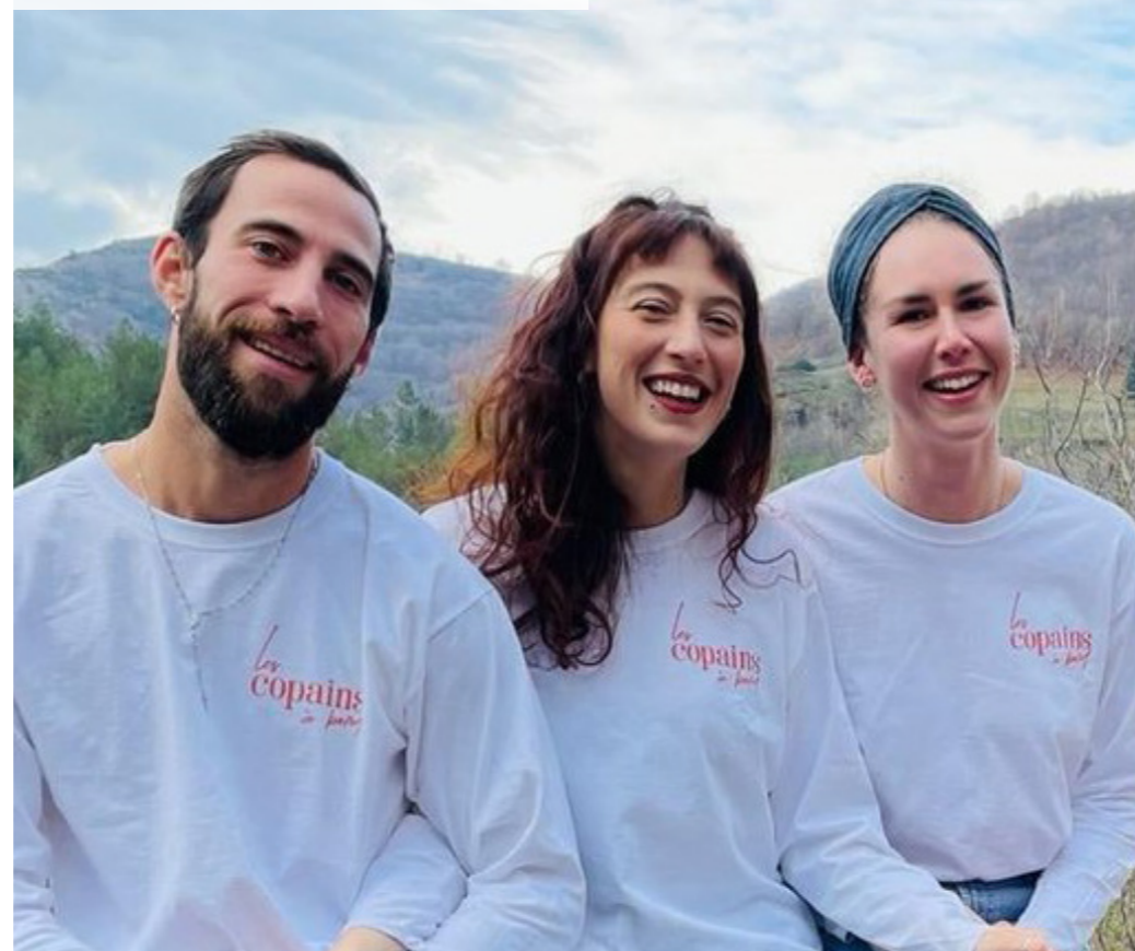
Les copains à bord Hébergement touristique au cœur des Cévennes (48)

Notre association accompagne l'installation et le développement de projets agricoles dans l'Hérault et les Pyrénées-Orientales par une approche qui mêle moments collectifs et suivis individuels. Grâce à la mobilisation de notre réseau de paysan.ne.s, nous offrons aux personnes accompagnées les meilleures conditions pour réussir leur installation.