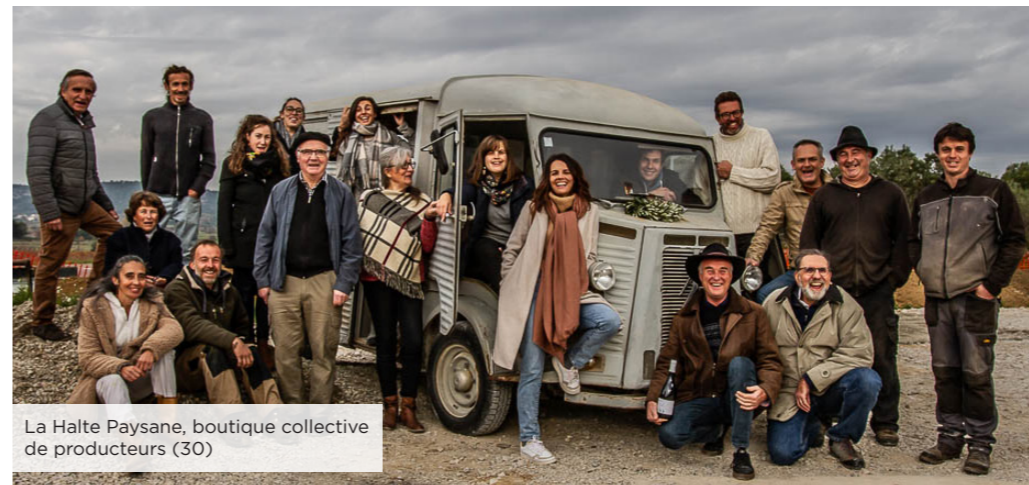
La Halte Paysane, boutique collective de producteurs (30)