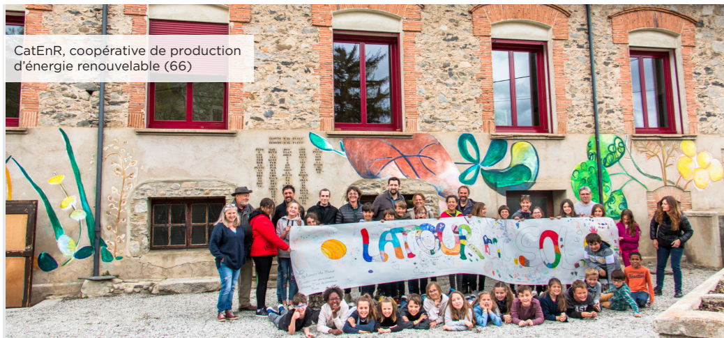
CatEnR, coopérative de production d'énergie renouvelable (66)

Parce nous croyons à la force du collectif pour répondre aux besoins non couverts sur notre territoire, nous mobilisons l'ensemble des acteurs publics, privés et citoyens autour des entrepreneurs. Nous leur proposons différentes formes d'accompagnement pour les appuyer dans leur recherche d'impact social et écologique. Au travers de programmes d'émergence, de formations, ou d'animation de communautés, nous permettons à chaque entrepreneur de s'engager pour un territoire plus solidaire.