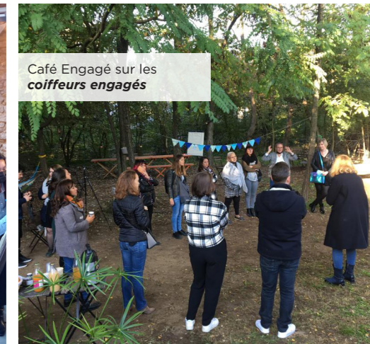
Café Engagé sur les coiffeurs engagés