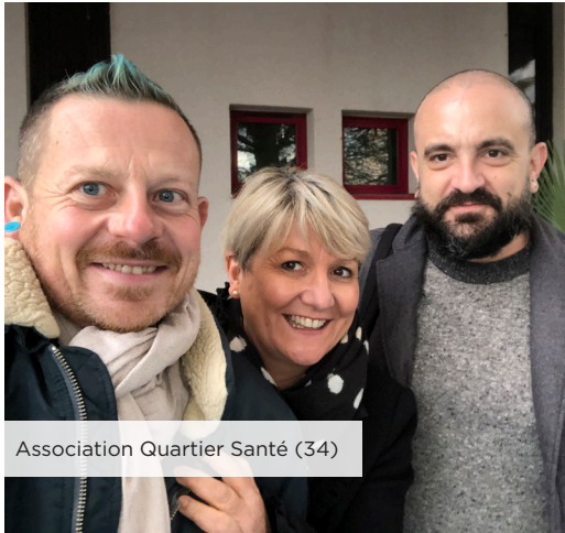
Association Quartier Santé (34)