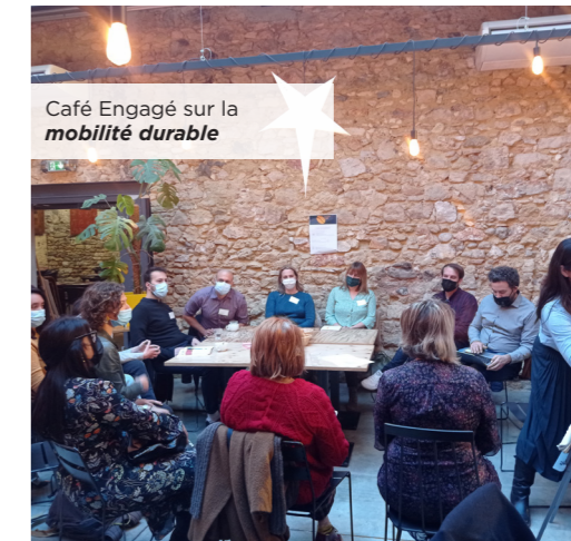
Café Engagé sur la mobilité durable

Vous pouvez retrouver les présentations, les informations pratiques et les outils concrets de chaque Café Engagé sur le site internet : franceactive-occitanie.org.