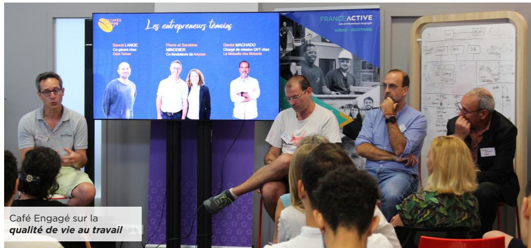
Café Engagé sur la qualité de vie au travail