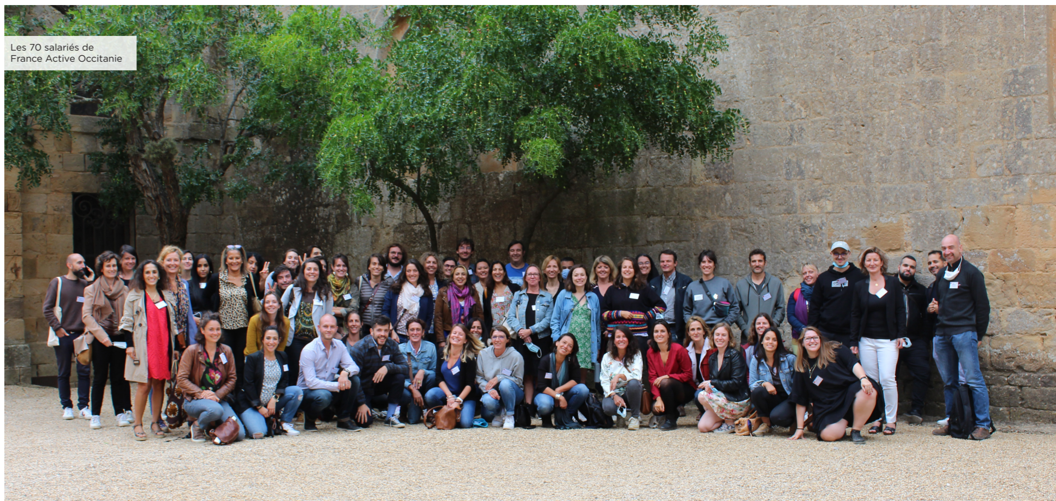
Les 70 salariés de France Active Occitanie

Cette société coopérative souhaite également participer au développement d'une économie plus respectueuse de l'homme en permettant à tous, et notamment aux plus précaires, de devenir acteur de leurs consommations.