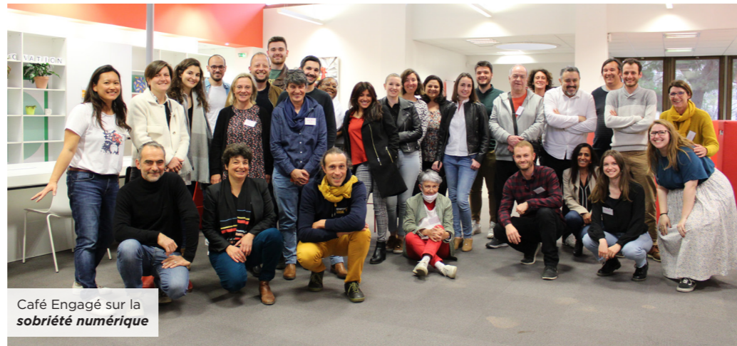
Café Engagé sur la sobriété numérique