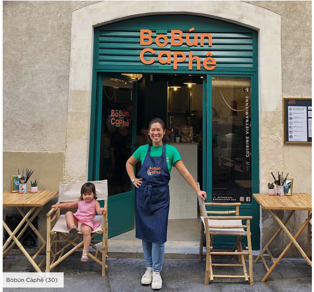
Bòbún Càphê (30)