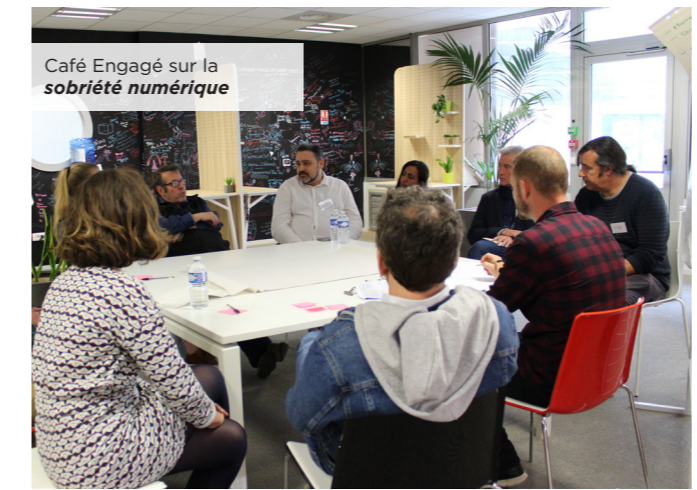
Café Engagé sur la sobriété numérique