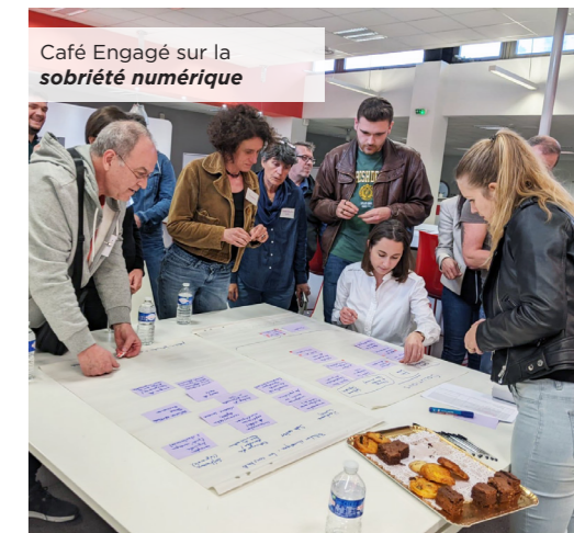
Café Engagé sur la sobriété numérique