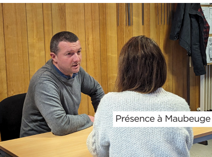
Présence à Maubeuge

Grâce à ces initiatives, Nord Actif s'affirme comme un acteur clé du soutien aux entrepreneurs dans le département du Nord, contribuant à un développement économique inclusif et durable pour tous.