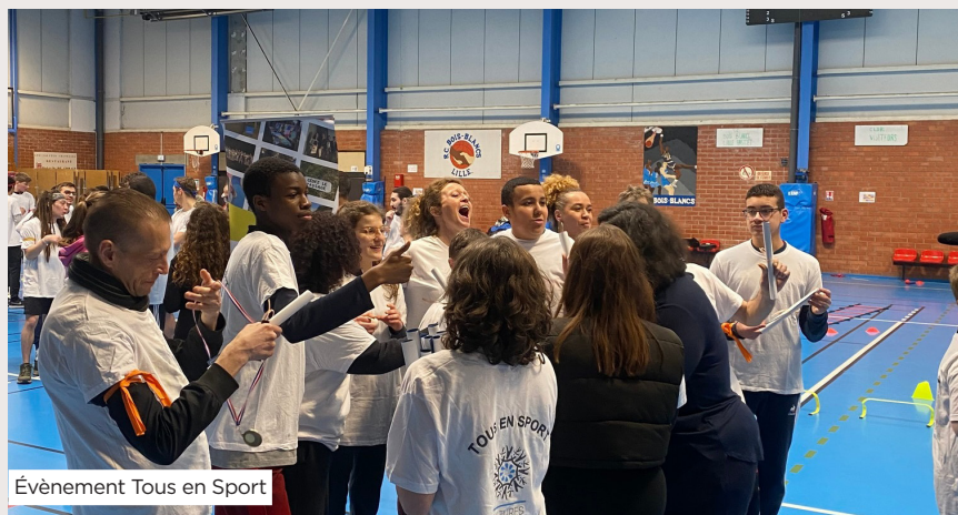
Évènement Tous en Sport

Créée en 2001, cette association a pour mission de faciliter l'accès aux pratiques culturelles comme levier d'émancipation et de lutte contre les exclusions. Elle propose des activités culturelles et sportives à des structures sociales, médico-sociales, et des associations de quartier, ciblant les personnes dites fragilisées. Partie intégrante d'un réseau national de 37 associations, elle intervient principalement sur la métropole lilloise, la communauté urbaine de Dunkerque, le Douaisis, et le Cambrésis.