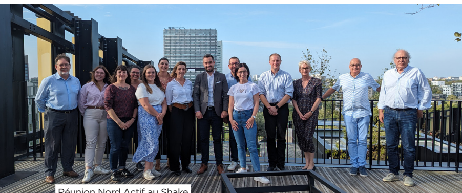
Réunion Nord Actif au Shake

engagement et leur collaboration, nous pouvons maximiser l'impact de nos actions et répondre efficacement aux besoins des structures que nous accompagnons. Nous sommes fiers de travailler avec des partenaires aussi dévoués et nous les remercions chaleureusement pour leur soutien renouvelé.