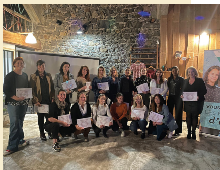
Les membres du réseau au Bal des Entrepren'Osent