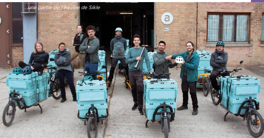
une partie de l'équipe de Sikle

Oui, nous recommandons vivement l'accompagnement DLA ! Dans une phase de croissance, être accompagné, c'est lever la tête du guidon pour éviter la crevaisson et ne pas perdre les pédales ! Une condition importante est selon nous la forte motivation des participants pour le projet concerné, ainsi que du temps dégagé pour travailler entre les séances d'accompagnement.